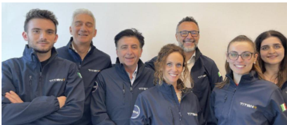
Il team multidisciplinare di Titan4

Additionally, our solutions include a robust API set that allows clients to integrate satellite data with their own GIS platforms. This flexibility enables organizations to leverage our satellite insights within their existing systems, enhancing their operational capabilities and decision-making processes. By combining satellite data with ground sensor information, Titan4 empowers stakeholders to maintain road infrastructure more effectively and efficiently, ultimately leading to improved safety and reliability.